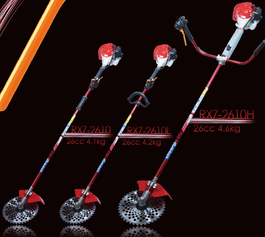
RXZ-2610 26cc 4.1kg