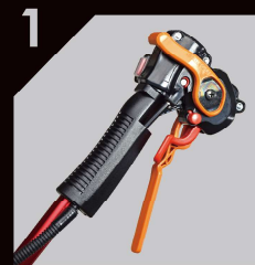
RXZ-2610H 26cc 4.6kg